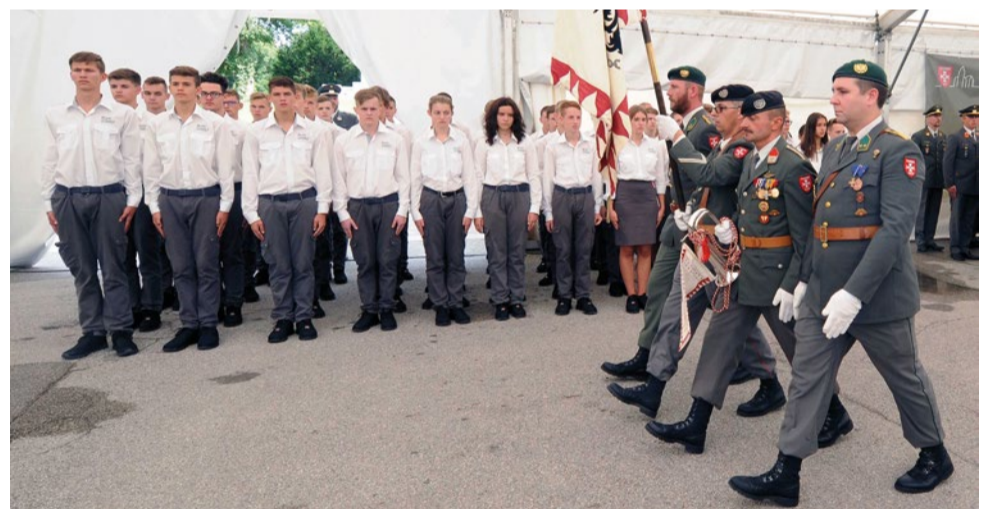
Eröffnung des Betriebs der Sicherheitsschule im September 2019

Pro Jahr stehen aktuell rund 50 Plätze an der Schule zur Verfügung. Weitere Informationen: www.milak.at/schule